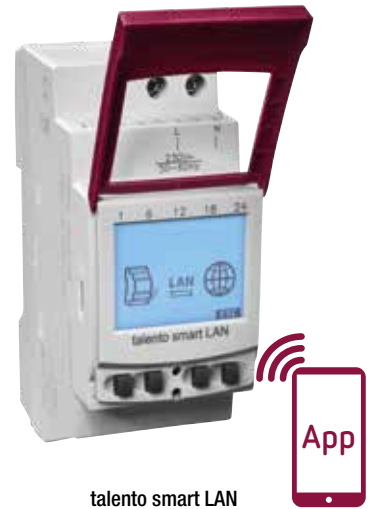
talento smart LAN