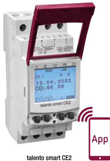
talento smart CE2