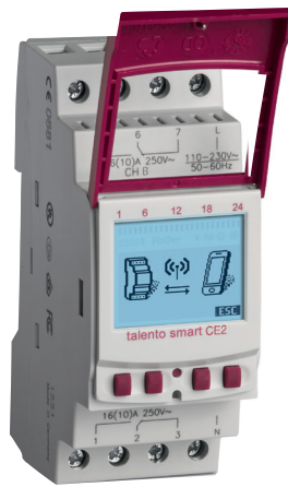
talento smart CE2