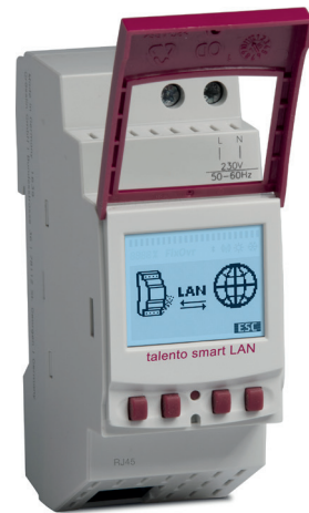
talento smart LAN