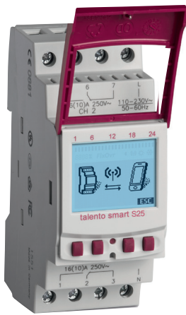
talento smart S25

Systemversion digitale Astro-Zeitschaltuhren, DIN-Schiene, Wochenprogramm